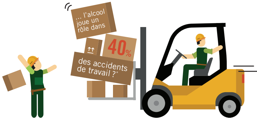
*selon une estimation du Bureau international du Travail